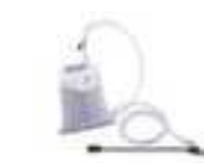
Sandsekk 50 kg Art. nr. PRCH00065