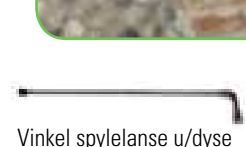
Vinkel spylelanse u/dyse M22, 90 cm Art. nr. LCPR29360