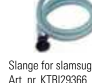
Slange for slamsuging, 5 m Art. nr. KTRI29366