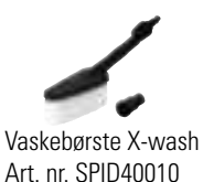
Vaskebørste X-wash Art. nr. SPID40010