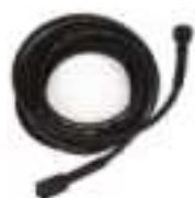
Høytrykkslange M22 skrukopling Art. nr. TBAP40107, 8 m Art. nr. TBAP40108, 12 m