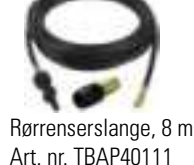
Rørrenserslange, 8 m Art. nr. TBAP40111