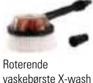
Roterende vaskebørste X-wash Art. nr. SPID40011