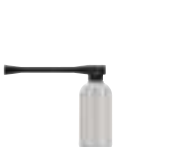
Skumlanse 1,0 liter Art. nr. 142007