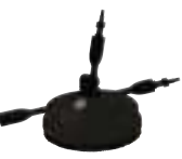
Terrassevasker Art. nr. LCLC40009 Art. nr. LCLC40010