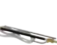
Sandblåsersett Art. nr. KTRI40239